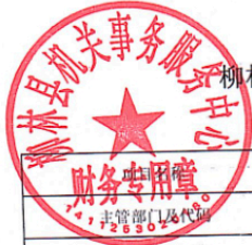
柳林县县(区)级预算部门(单位)项目支出绩效目标表