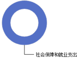
一般公共预算当年拨款结构图

2023年度一般公共预算当年拨款58.64万元，主要用于以下方面：社会保障和就业支出58.64万元，占100.00%。