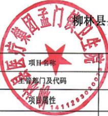
柳林县县(区)级预算部门(单位)项目支出绩效目标表