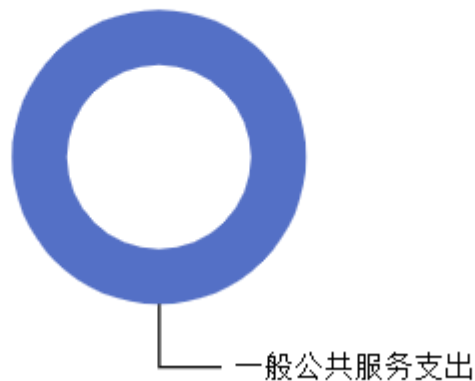
一般公共预算支出结构图

2026年度国家统计局柳林调查队一般公共预算当年支出84.52万元，主要用于以下方面：一般公共服务支出84.52万元，占100.00%等。