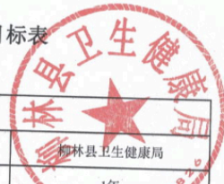
柳林县县(区)级预算部门(单位)项目支出绩效目标表 (2025年度)