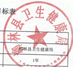
柳林县县(区)级预算部门(单位)项目支出绩效目标表 (2025年度)