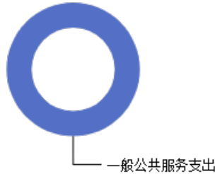
一般公共预算当年拨款结构图

2023年度一般公共预算当年拨款128.21万元,主要用于以下方面: 一般公共服务支出128.21万元,占100.00%。